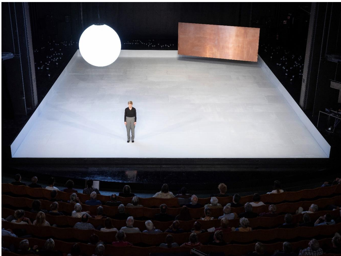
Sandra Hüller