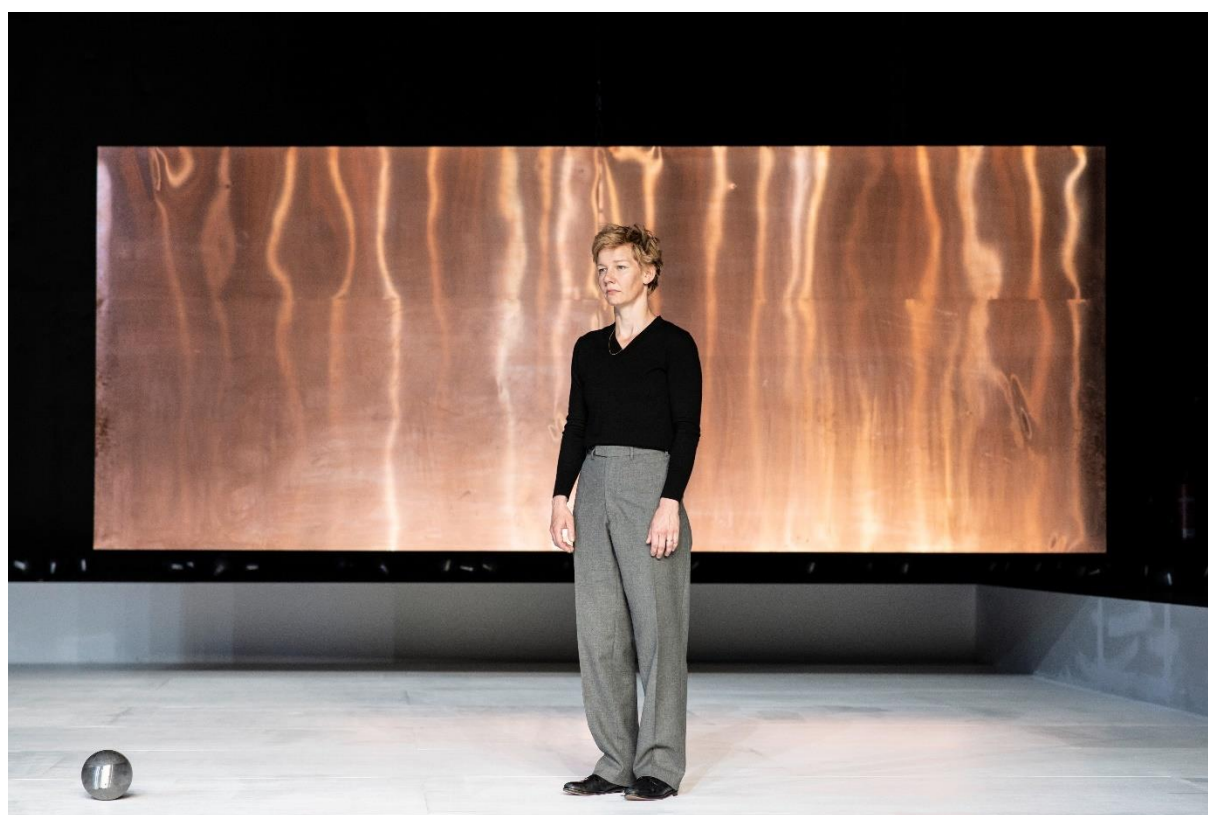
Sandra Hüller © JU Bochum