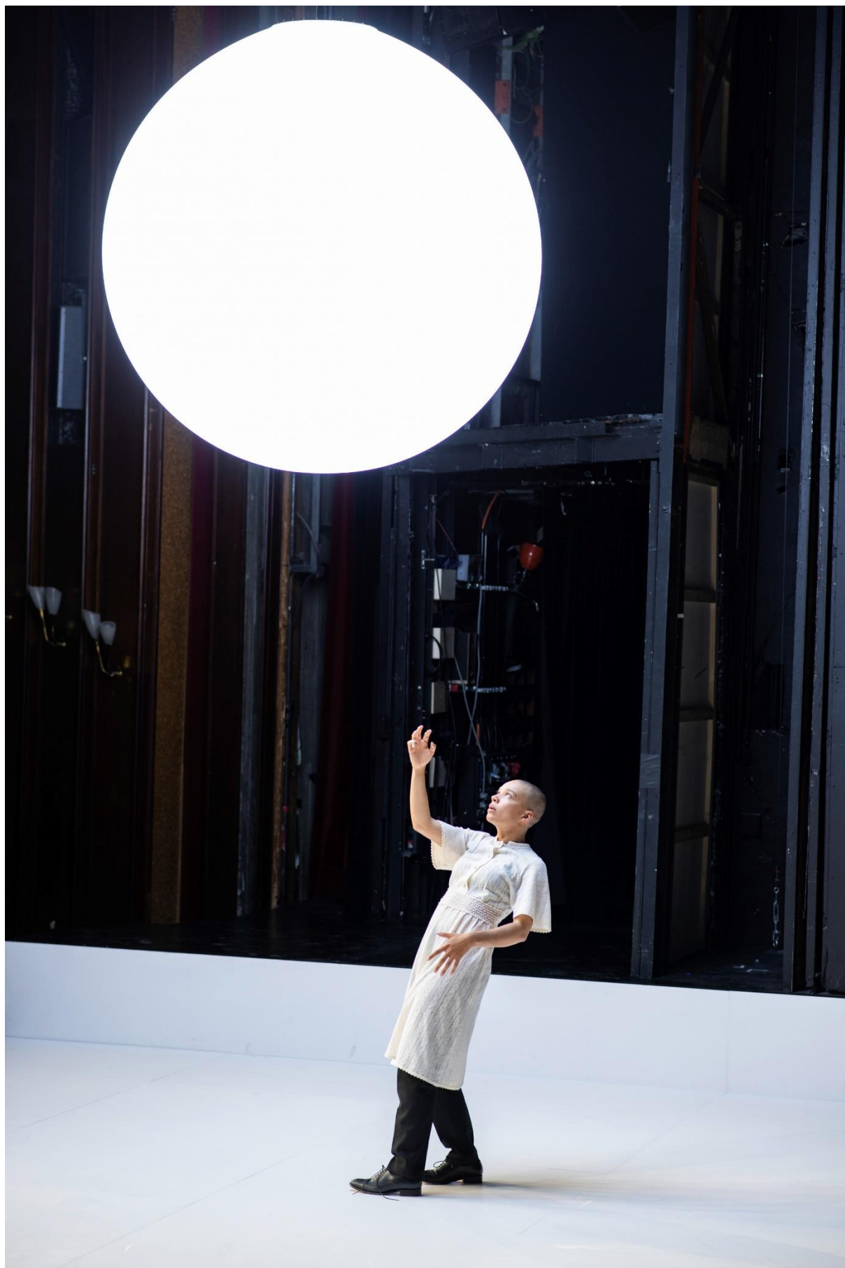
Gina Haller © JU Bochum