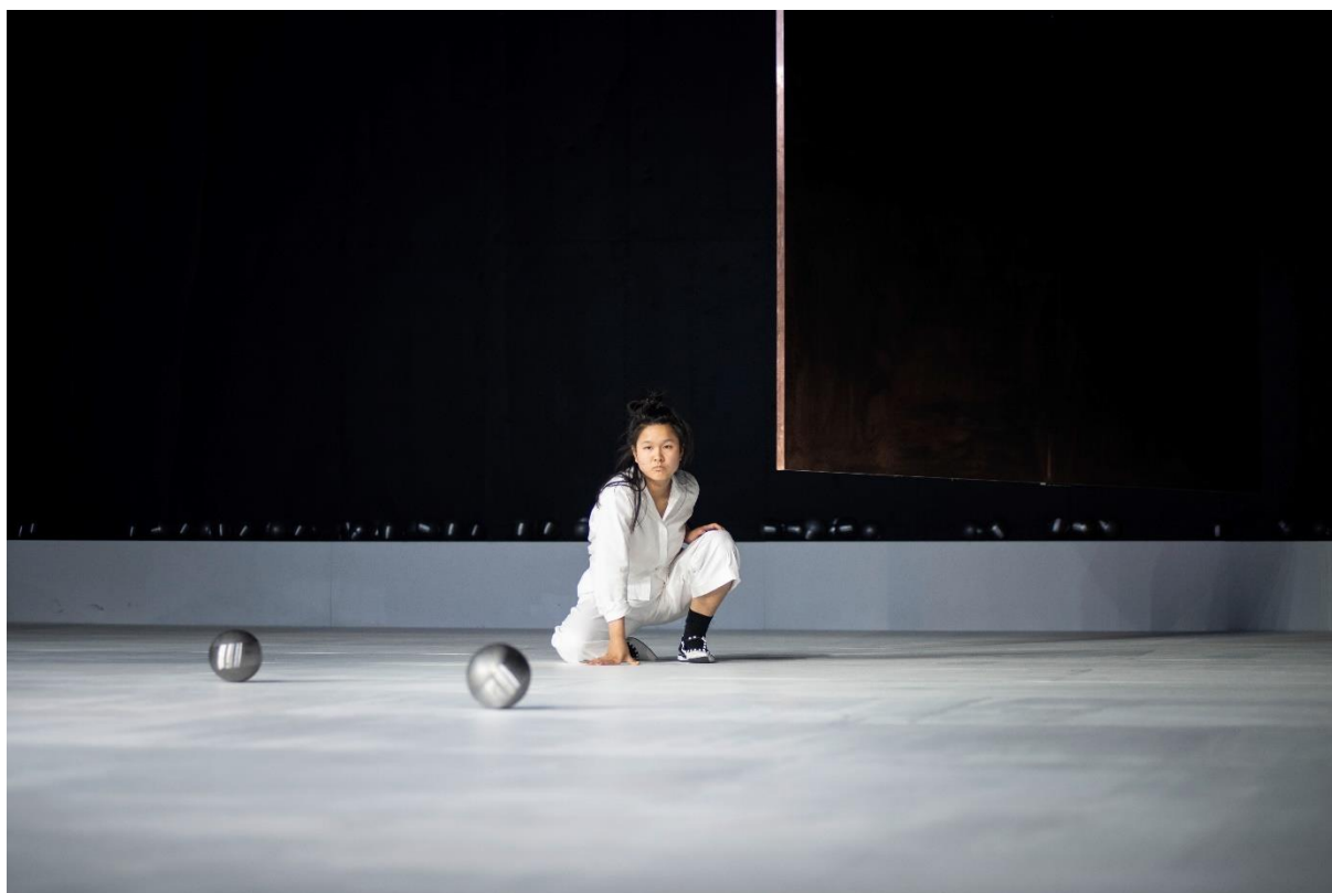
Jing Xiang