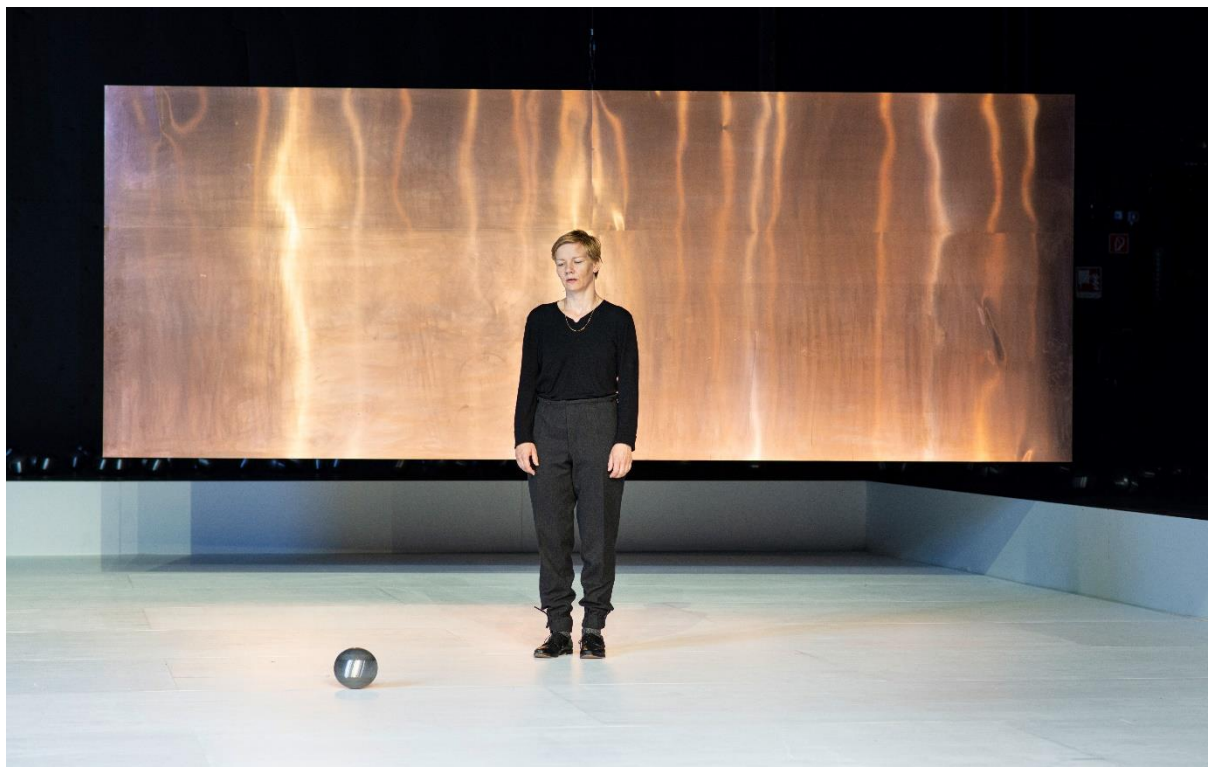
Sandra Hüller