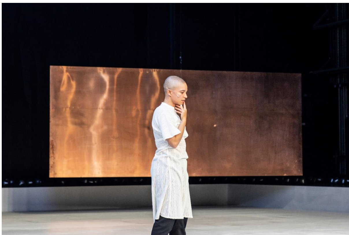
Gina Haller © JU Bochum