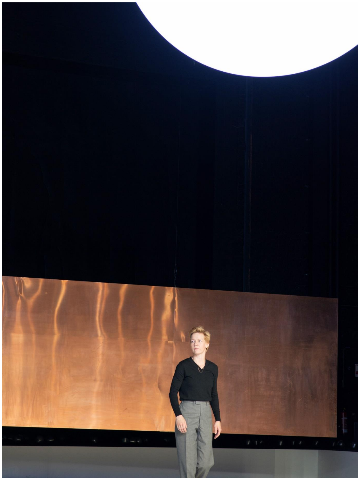
Sandra Hüller