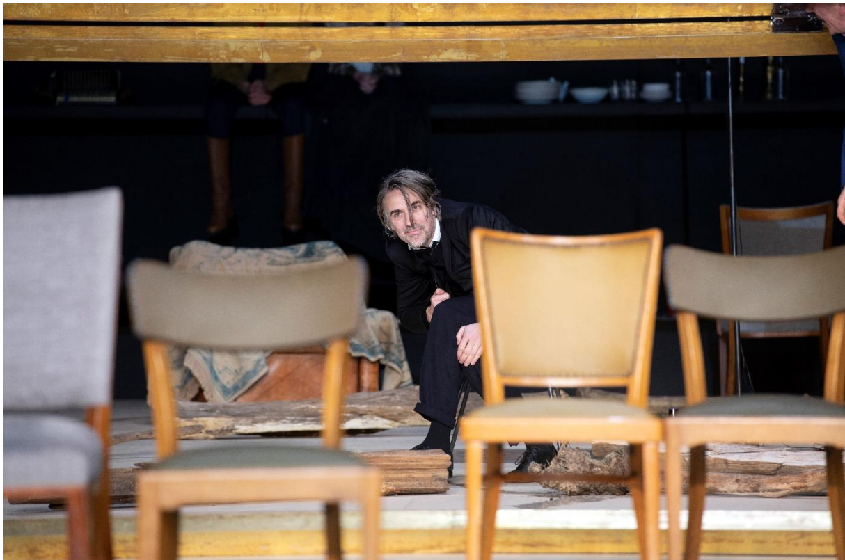
Jens Harzer