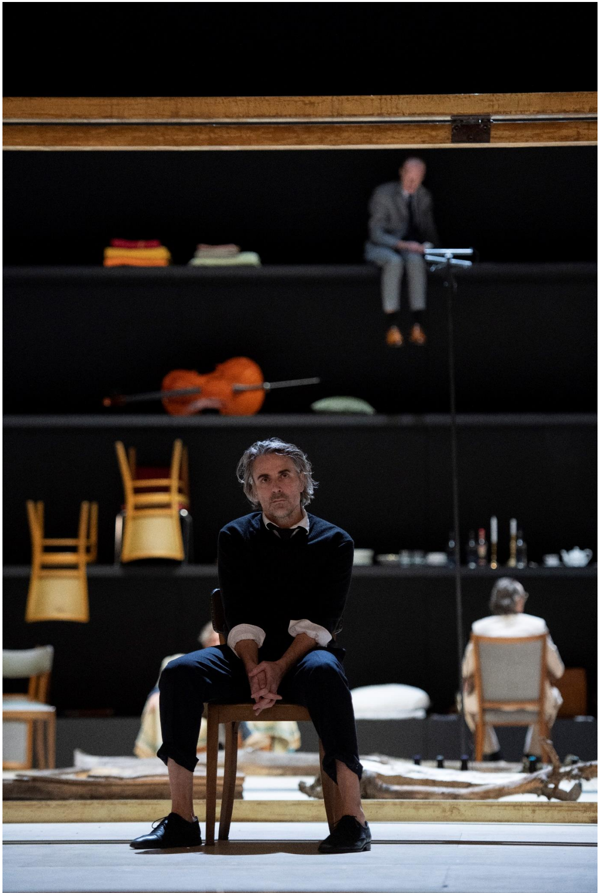
Jens Harzer