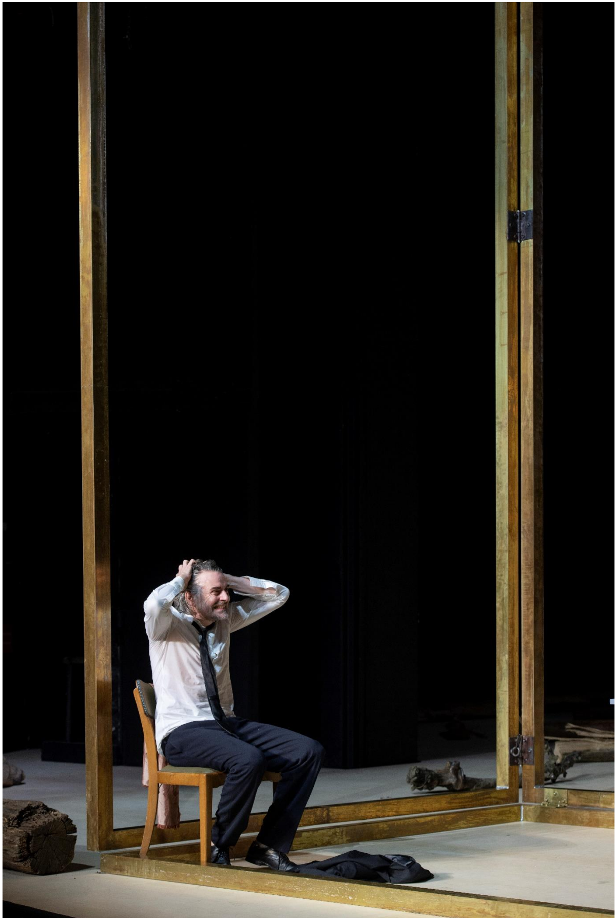
Jens Harzer