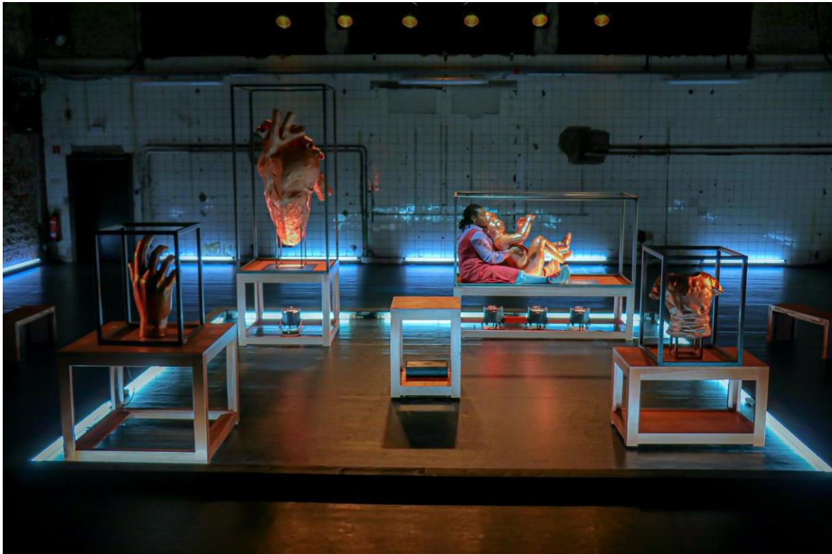
Romy Vreden © Emelym Yábar Tito