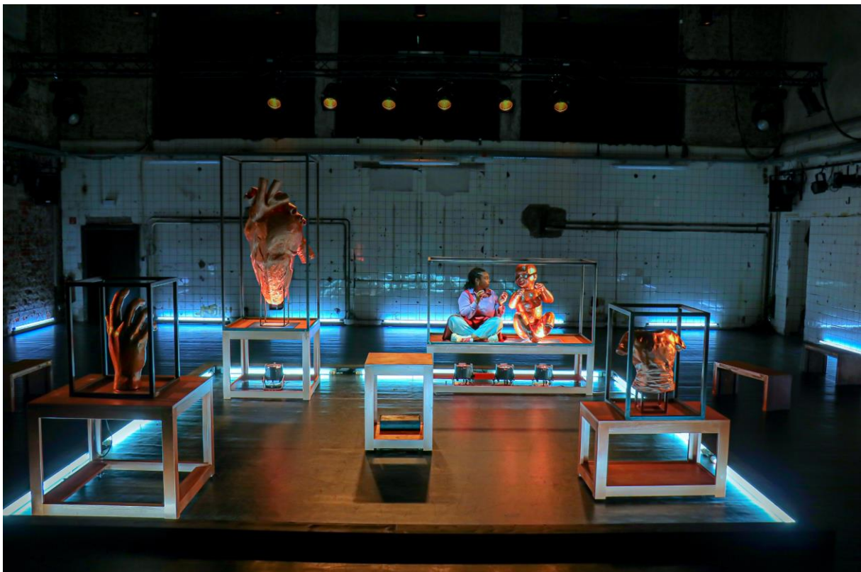
Romy Vreden