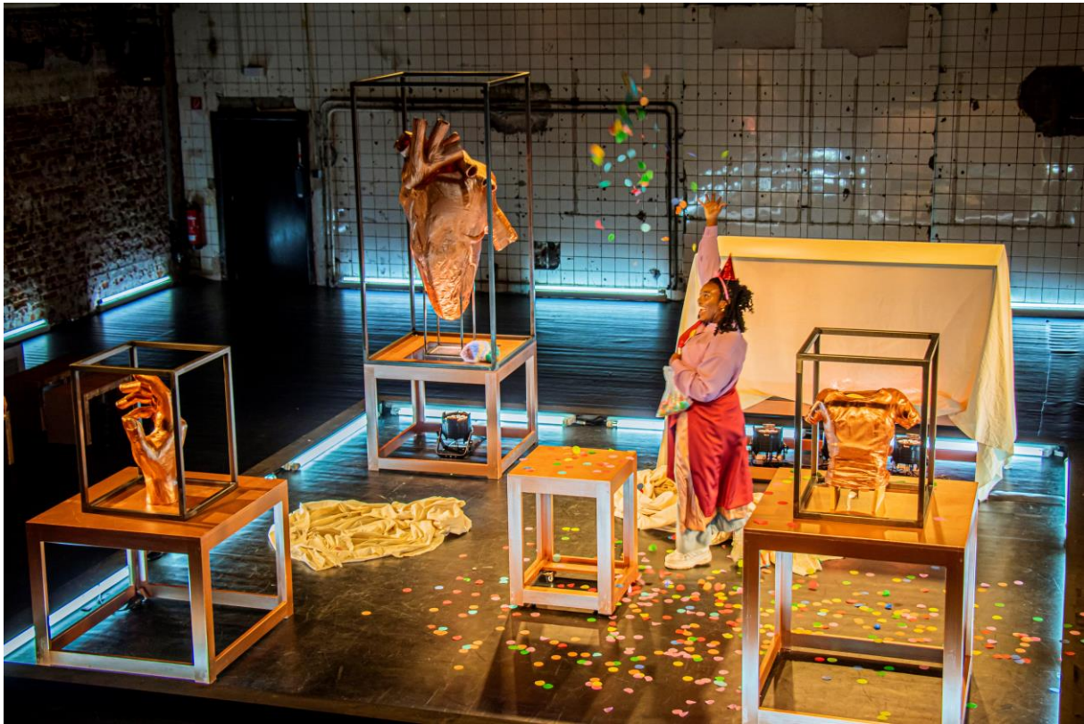
Romy Vreden