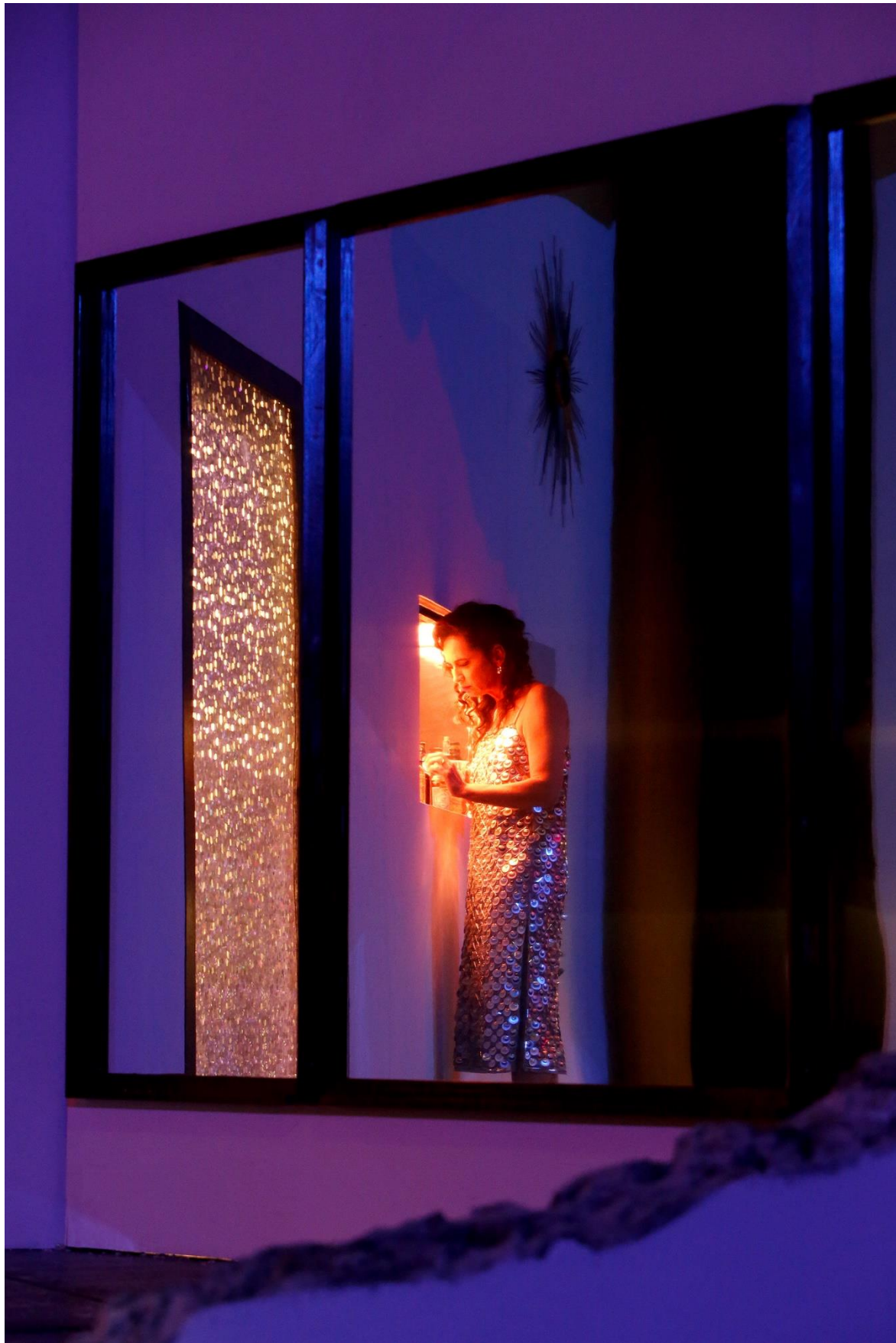
Jele Brückner