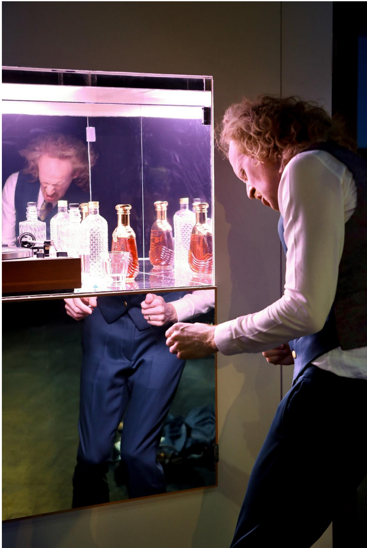
Konstantin Bühler