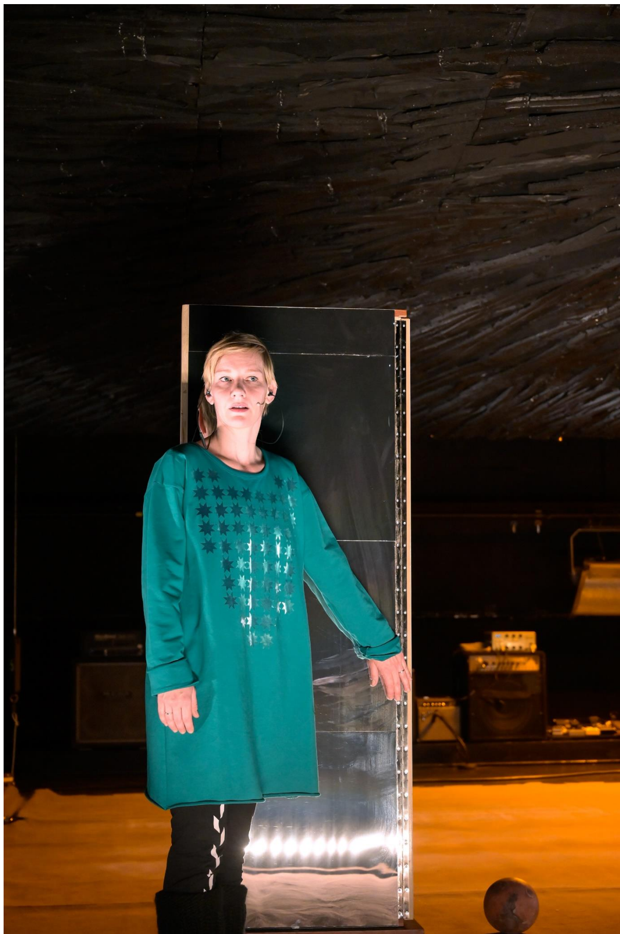
Sandra Hüller