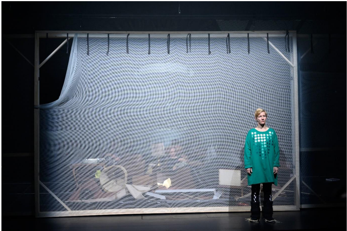
Sandra Hüller