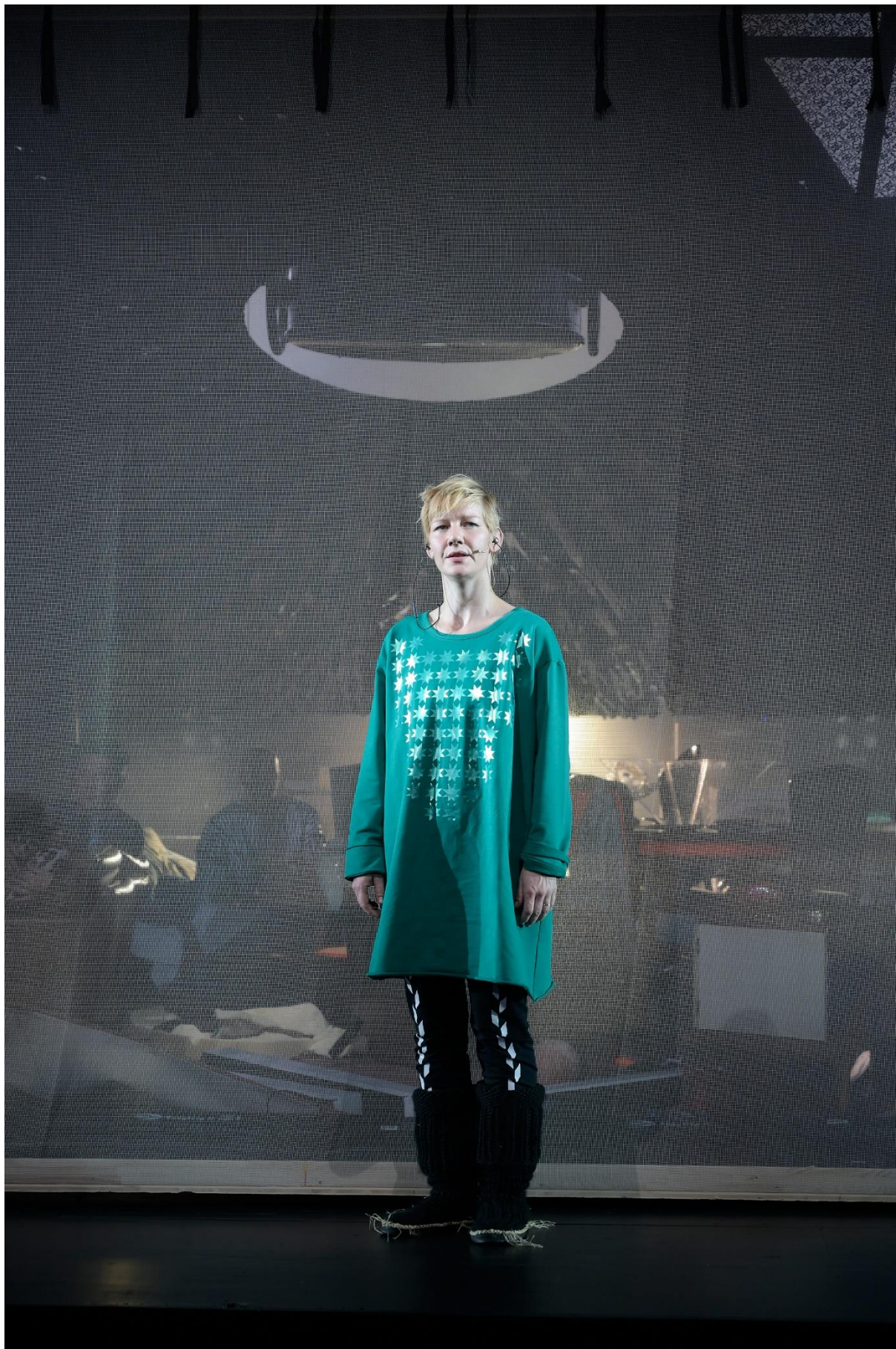
Sandra Hüller