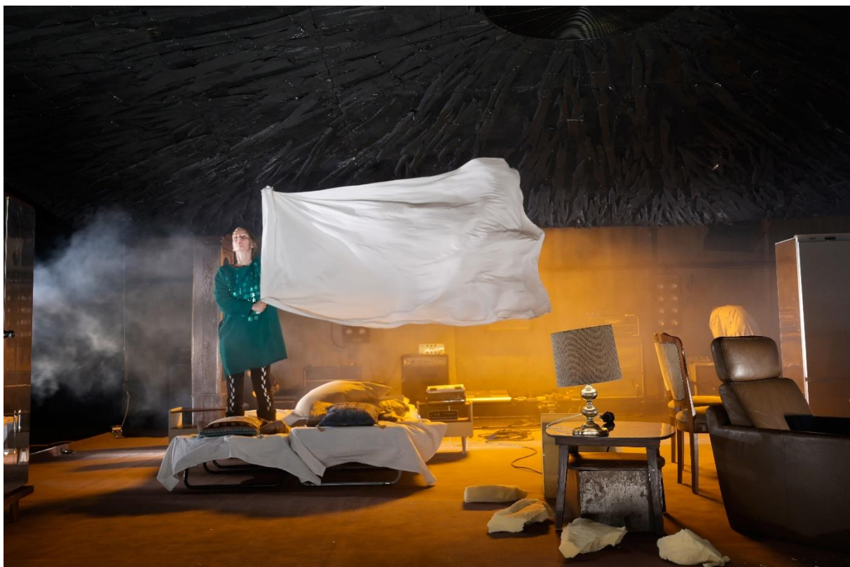
Sandra Hüller