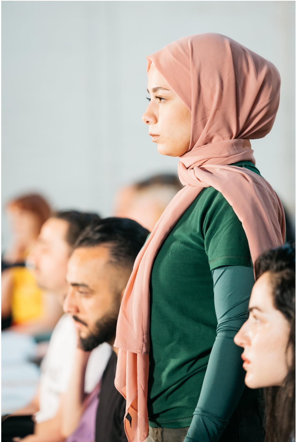
Die Schutzbefohlenen – Was danach geschah (2024)