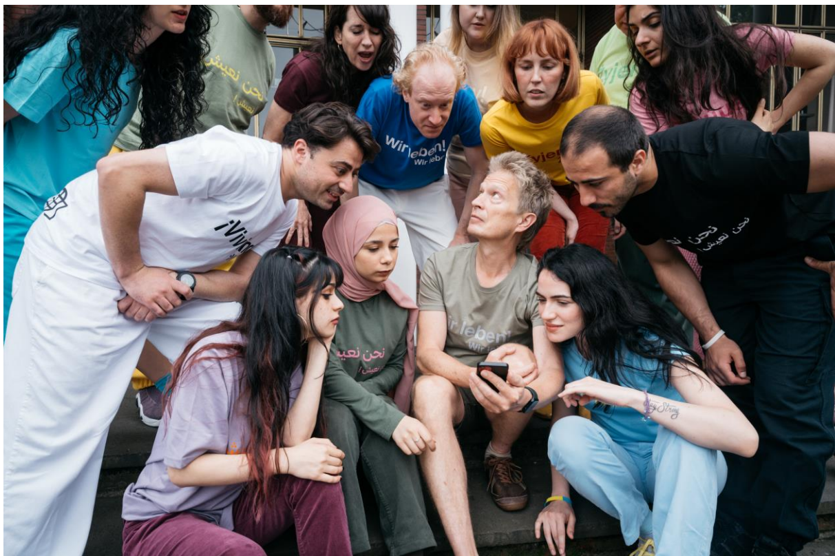
Die Schutzbefohlenen – Was danach geschah (2024)