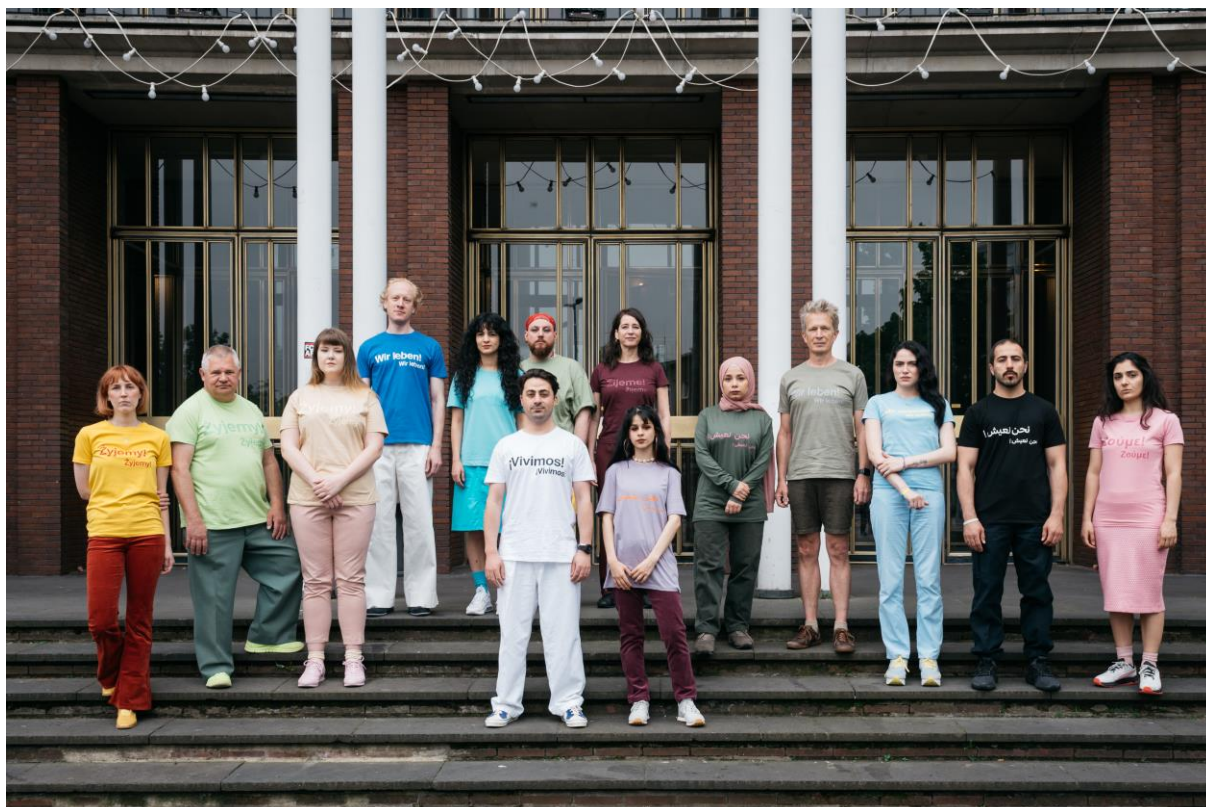
Die Schutzbefohlenen – Was danach geschah (2024)