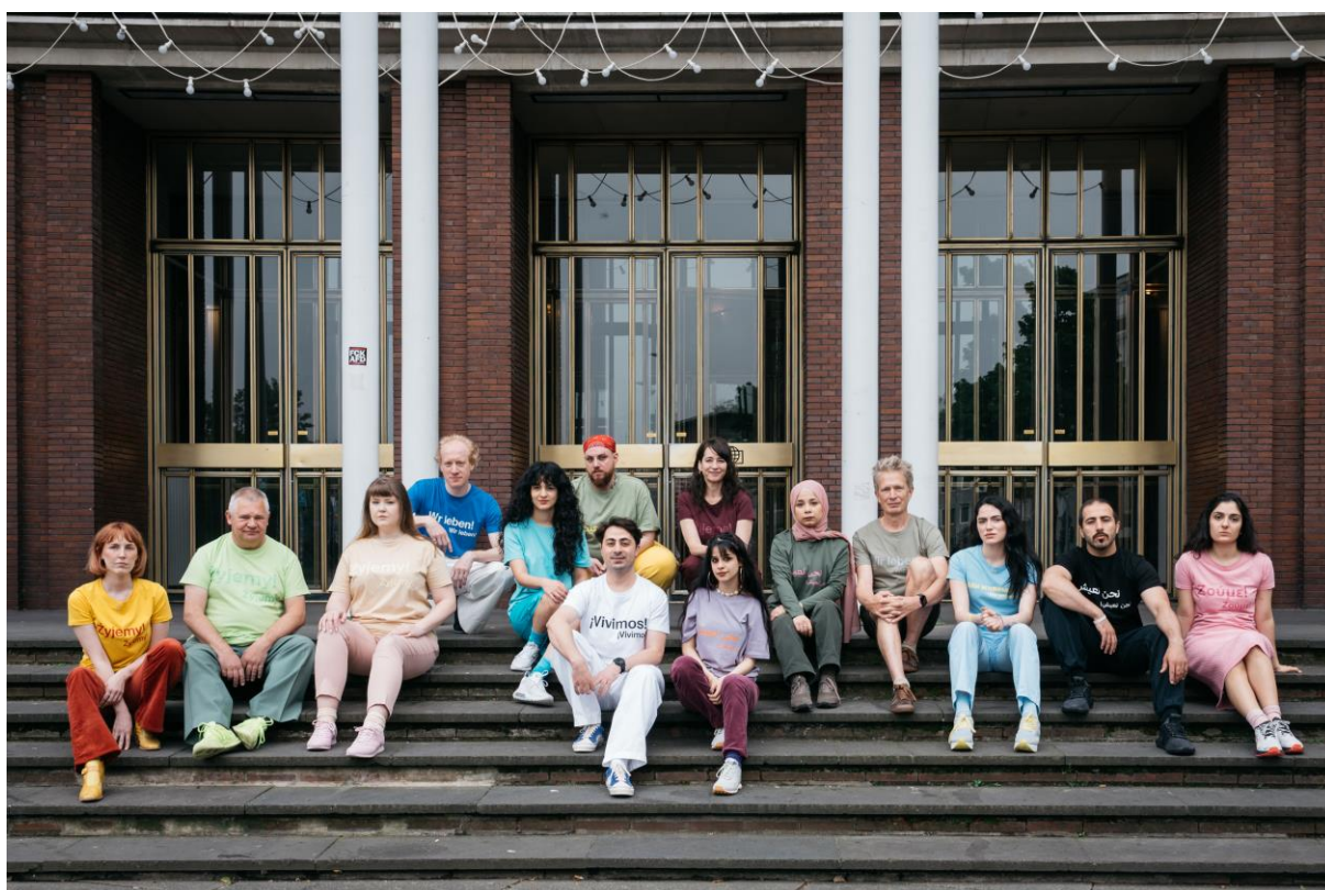
Die Schutzbefohlenen – Was danach geschah (2024)