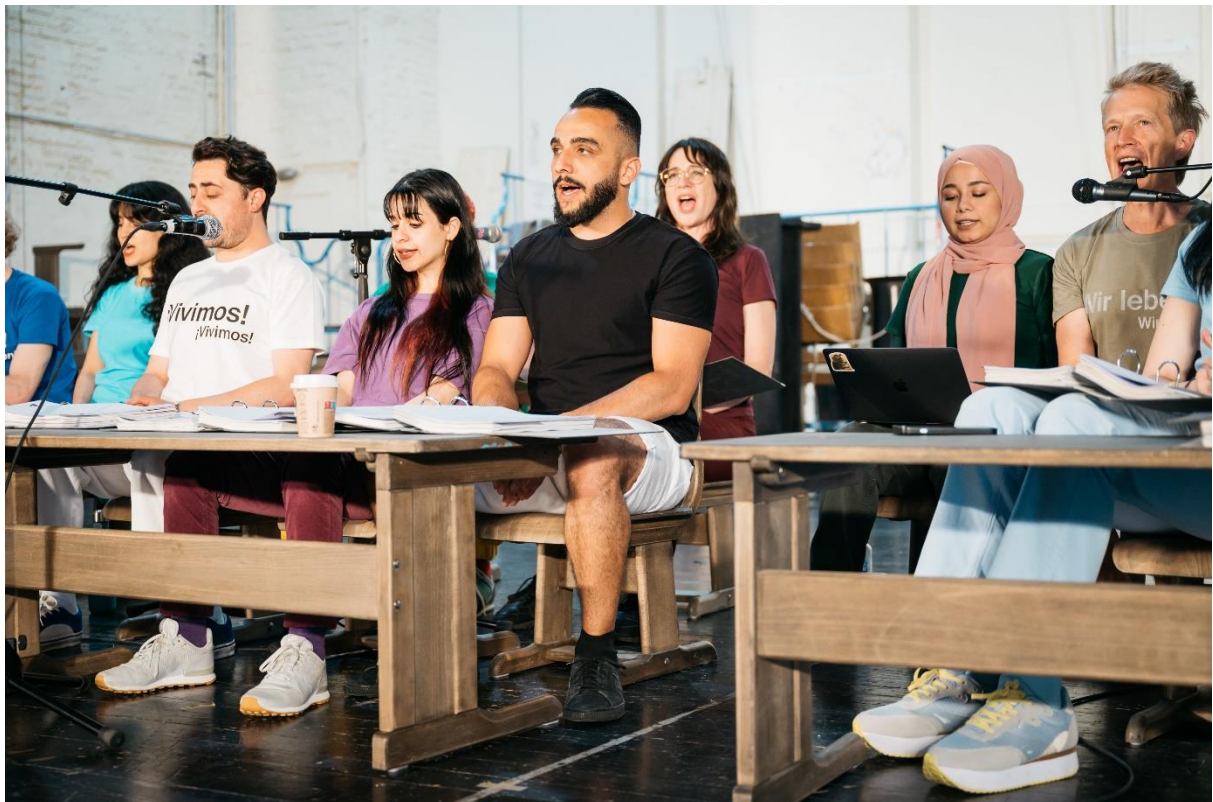
Die Schutzbefohlenen – Was danach geschah (2024)