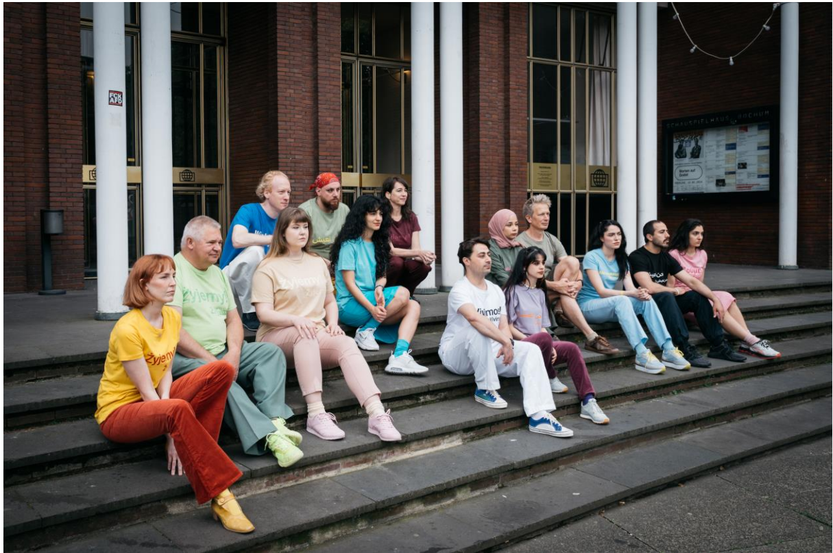
Die Schutzbefohlenen – Was danach geschah (2024)