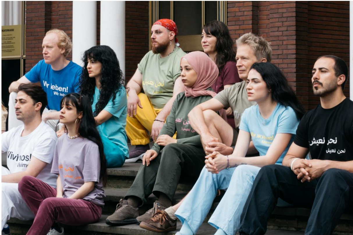
Die Schutzbefohlenen – Was danach geschah (2024)