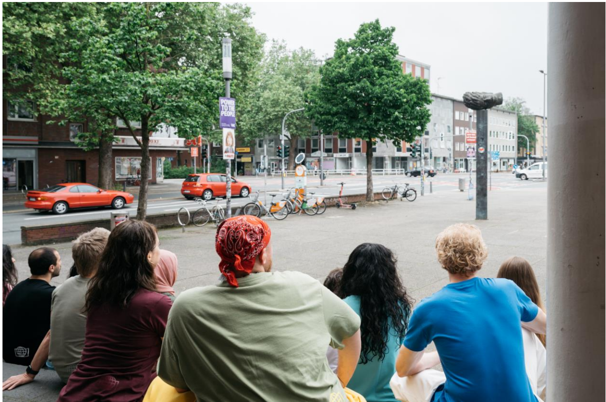
Die Schutzbefohlenen – Was danach geschah (2024) © Daniel Sadrowski