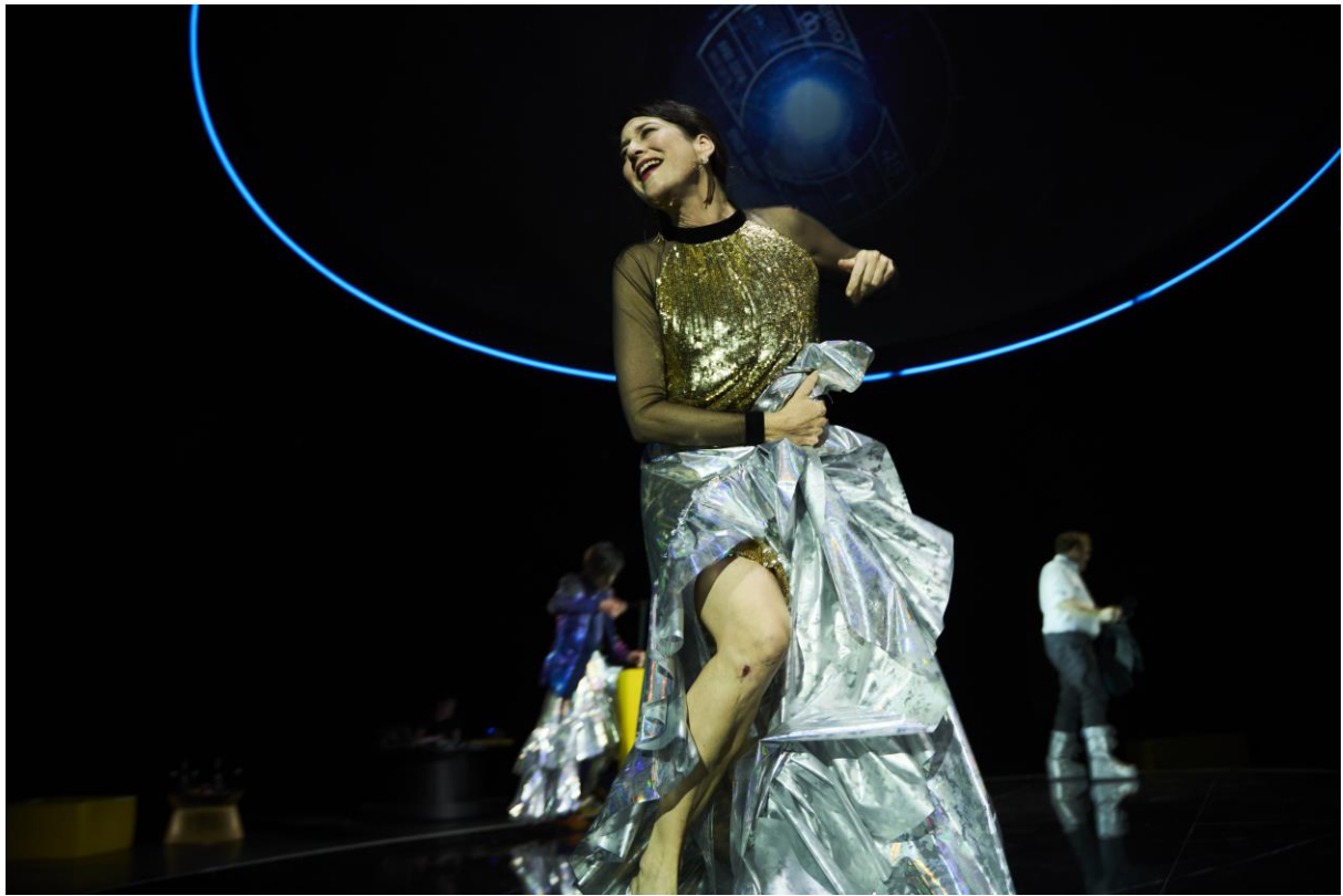
Jele Brückner