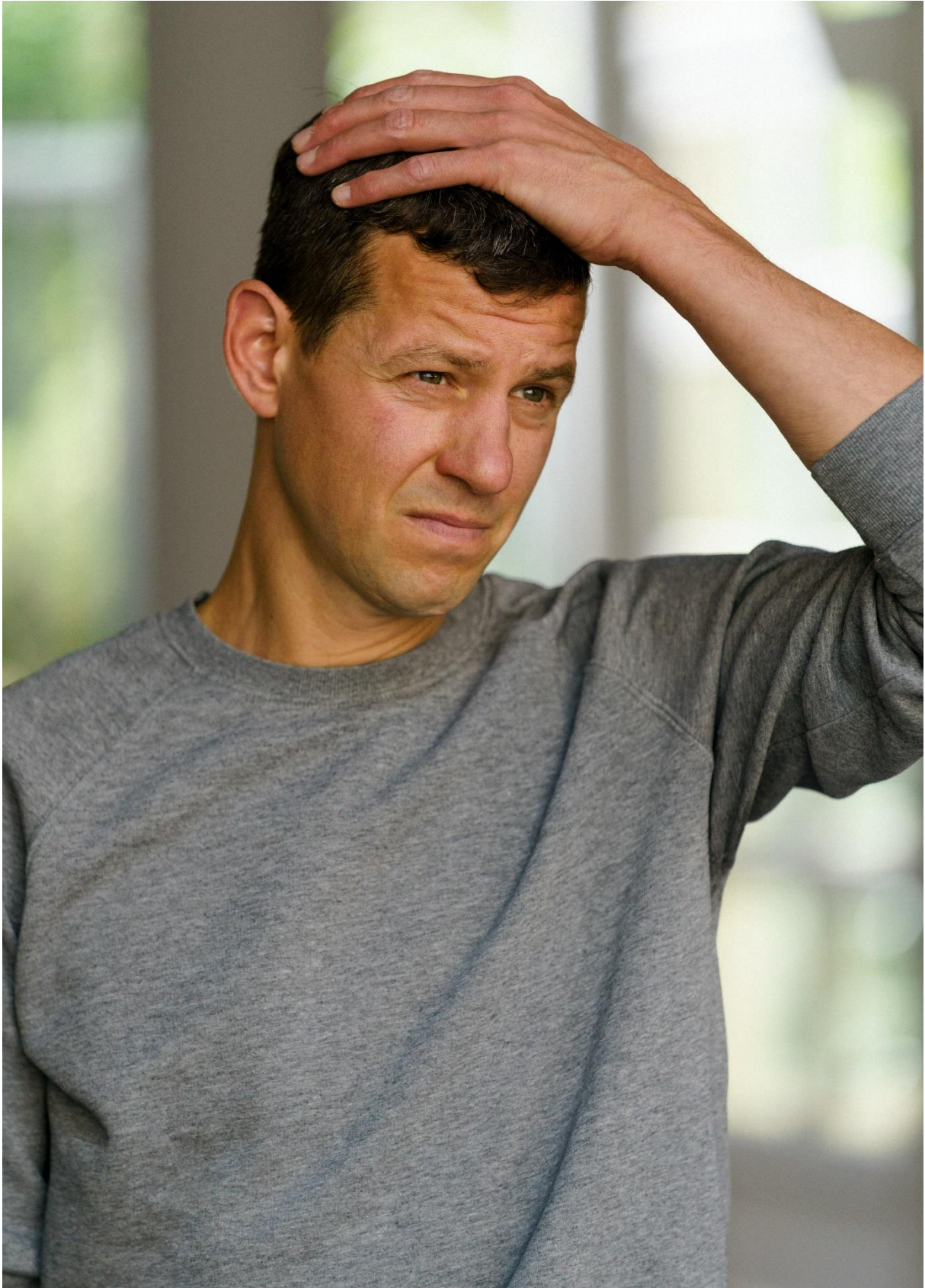
Ole Lagerpusch © Max Zerrahn