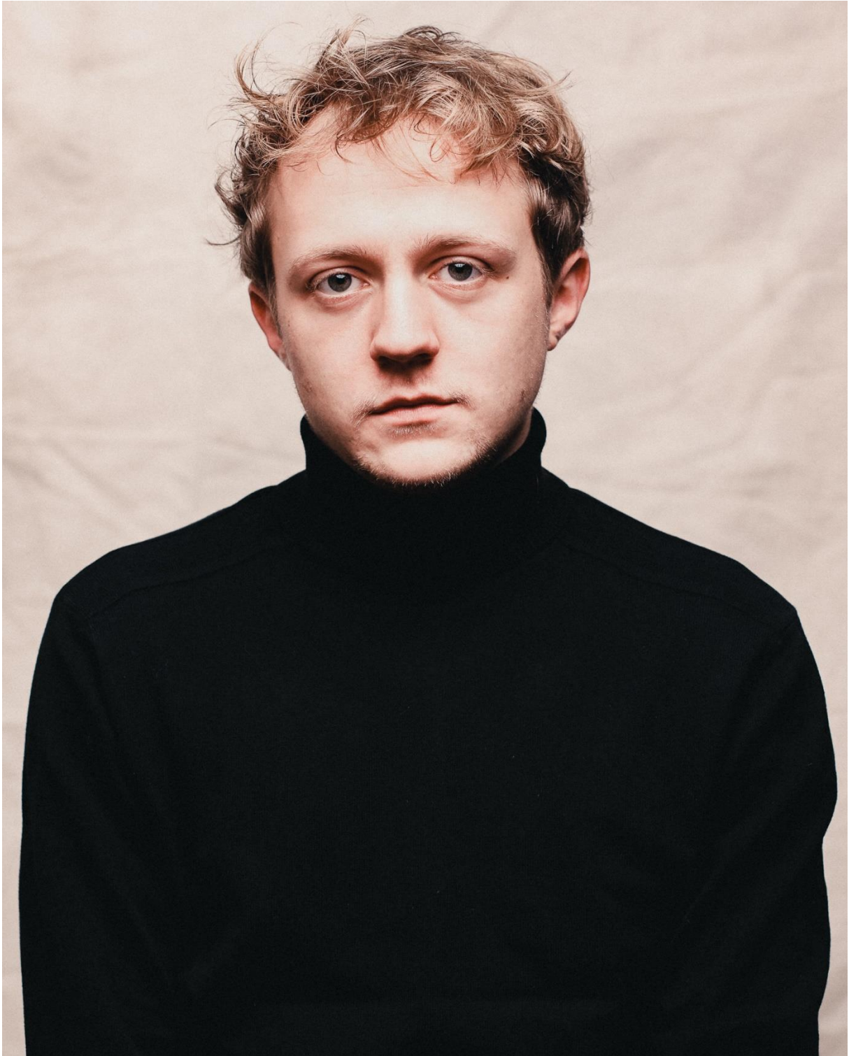
Jakob Schmidt